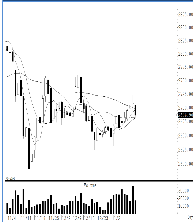
GOH25 (Close 2,686.90 Chg -22.20)

ราคาทองคำโลกแกว่งฟื้นตัวขึ้นมาในจุดสำคัญอีกครั้ง เราแนะนำการเทรดสูง หรือตั้ง stop ไว จากความผันผวนของราคาที่เราคิดว่าแกว่งแรง แนะนำ trading ในกรอบ 2,680-2,702 ดอลลาร์ ระวังถ้าไร ในกรณีที่ปิดต่ำกว่า 2,680 ดอลลาร์ แนะนำ ถือ short หวังผลปรับตัวลงไปแถว ๆ 2,590 ดอลลาร์ ระวัง ถ้าไร เรากำหนดจุด stop สำหรับข้าง short ไว้ที่ 2,725 ดอลลาร์